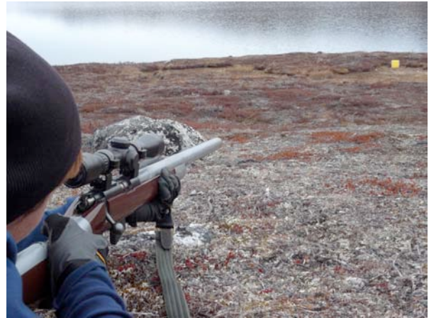
Skydning i Triathlon i Itinnera