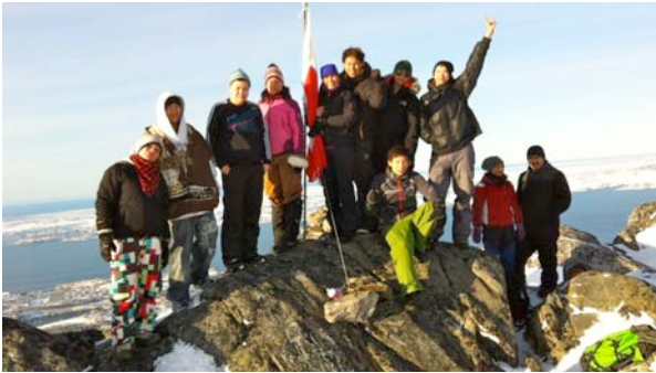
Toppen af Ukkusissat, Storemalene