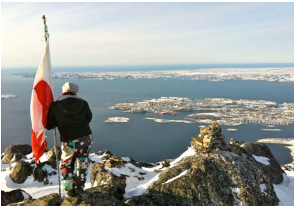
Fremtiden er foran mig og jeg vil fremtiden

TIMI ASIMI programmet er kommet for at blive. Piareersarfik, Grønlands Selvstyre og samtlige af vores instruktører er ikke i tvivl om det overvældende succes af vores nystartede projekt. Et levedygtigt og livsbekræftende projekt blev dermed grundlagt for bedre muligheder for unge der er gået i stå i uddannelsessystemet, eller for unge der skal hjælpes videre i livets udfordringer for et sundere liv samt livslangt uddannelse.