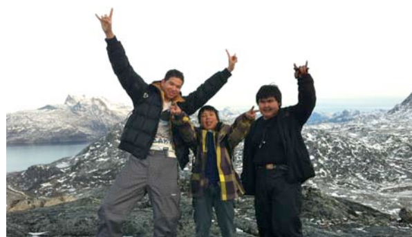
Toppen af Lillemalene

De første vandreture krævede mange fysiske anstrengelser og der kom et klart billede af hvilken elever der kunne "overleve" hele turen. Det positive var, at se den stærkt øgede råstyrke ved de sidste vandreture, især den sidste vandretur til Kapisillit var uden sidestykke. 1 time 40 minutter fra Itinnera til Kapisillit er den sidste rekord og efterfølgende legeaktivitet med skolens børn med rundbold og tag fat leg fra Idrætskassen i Kapisillit. Det var ren leg at vandre næsten 20 km i alt, og stor tilfredshed blandt instruktører at elevernes nye styrke.