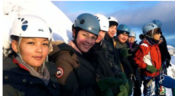
Rapelling i Nuuk