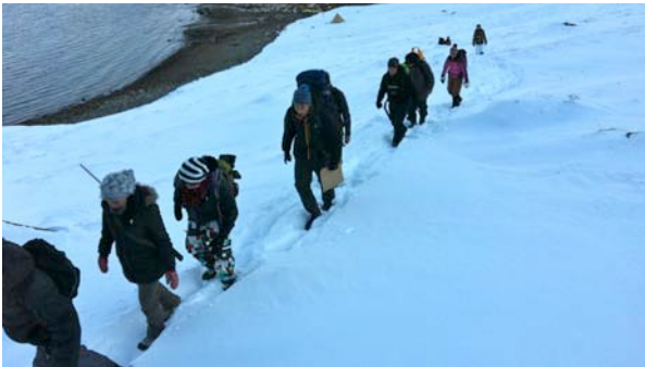
TIPI ophold og vandring i Kuanninnguit