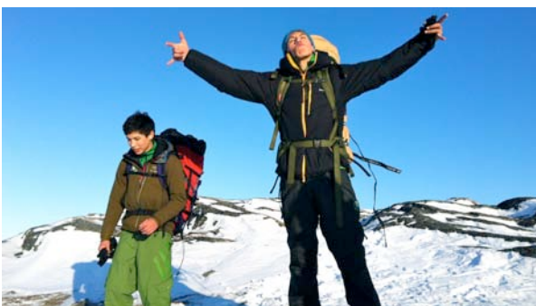
Fantastisk dejlig vandretur ti Kuanninnguit

Formålet med TIMI ASIMI er, at de unge får mere viden om naturens muligheder og det at være i naturen. Forskning har vist, at bevidst og målrettet arbejde i naturen kan forbedre de unges trivsel, fordi de unge opnår større sociale kompetencer og oplever større skoleglæde. Samtidigt oplever de unge mindre stress og mobning. Der lægges vægt på daglige fysiske trænings udfordringer med idræt, teambuilding og succesoplevelser for de unge for at motivere med glæden ved at have et mål med livet samt et sundere livstil.