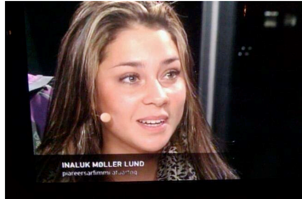
TIMI ASIMI med Inaluk som gæst i TAMASSA

Projektet blev tæt fulgt af KNR Radio hvor der var 3 udsendelser om projektet. Det hele kulminerede med TV tid i programmet, TAMASSA, hvor seere over hele landet stiftede bekendtskab med 3 af eleverne og om TIMI ASIMI projektet.