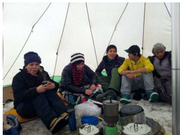
Spisning og frokost i TIPI telt, Kuanninnguit