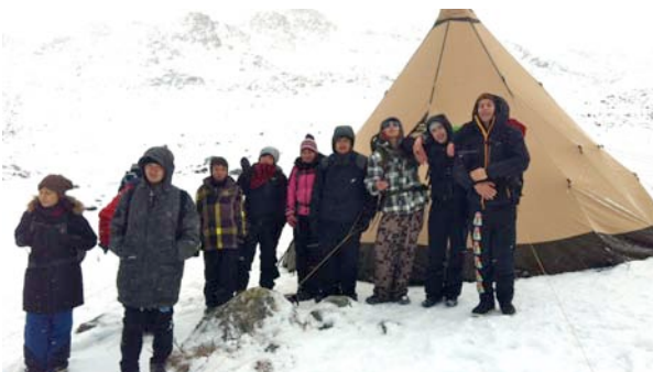
Kuanninnguit TIPI lejr