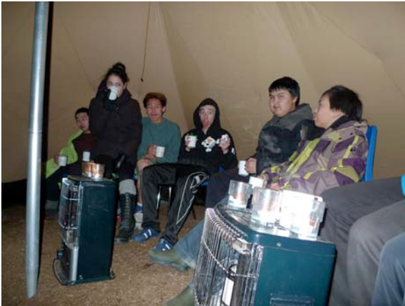
Aftenmøde i TIPI teltet i Itinnera