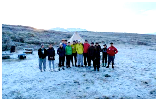
Første morgenløbetur i Itinnera