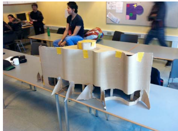
Model af Katuaq if. teambuilding

Projektet blev tæt fulgt af KNR Radio hvor der var 3 udsendelser om projektet. Det hele kulminerede med TV tid i programmet, TAMASSA, hvor seere over hele landet stiftede bekendtskab med 3 af eleverne og om TIMI ASIMI projektet.