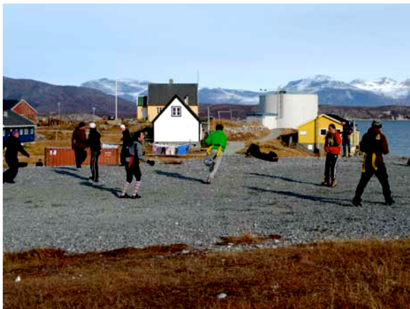
Lege event med skolen i Kapisillit

Inden rejsen planlagde de unge mange lege og udendørsaktiviteter. Men de fandt hurtigt ud af hvor meget energi der skal bruges for at opretholde en lejr med madlavning og andre gøremål. Derfor blev der kun leget få aktiviteter da kulden og sneen satte begrænsninger for optimale betingelser. Det var også en udfordring i sig selv.