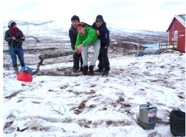
Vinderholdet til teambuilding test

Der blev også lavet forskellige teambuilding opgaver for de unge hvor de virkelig blev rustet godt sammen med deres kammerater. Et af de meget centrale dele af projektet er at kunne håndtere primus til madlavning eller opvarmning af vand. En af opgaverne var at lave 3 pinde til én pind med tov og samle en kogegryde med pinden, hente vand på søen 1 km væk og koge vand til instruktørernes kaffe og vennerne.