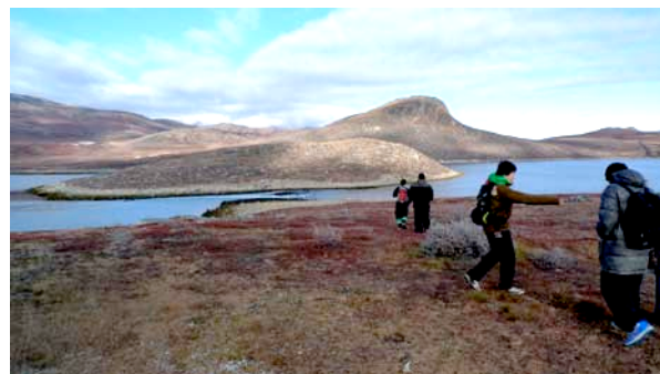
Vandretur til Ameralik

Alle elever var ikke vant til at vandre i hverdagen. Og en af de vigtigste opgaver og aktivitet er vandreturene i Itinnera området. Og der blev vandret rigtig meget. 2 ture til Ameralik og 2 rensdyrjagter, dog uden dyr, og mange små topture til fjeldtoppene.