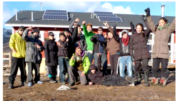
Itinnera sidste dag 2011

TIMI ASIMI programmet varer 4 måneder og vi har 20 elever i hvert hold. 1. hold starter den 1. marts og det andet hold starter medio september og frem til ultimo december.