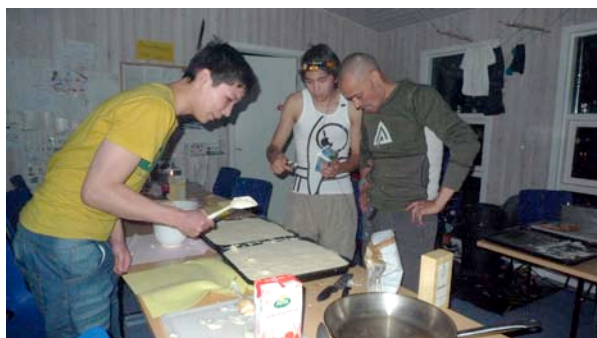
Lagsagne aften i Itinnera