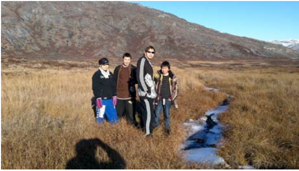
Vandretur Kapisillit – Itinnera 19 km